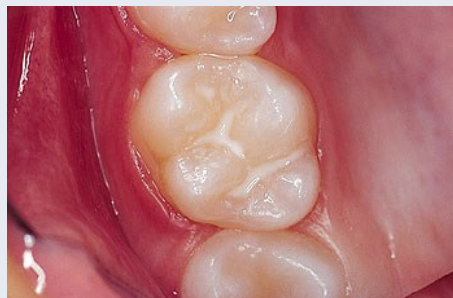
Schutz vor Karies: Versiegelung der feinen Grübchen auf der Kaufläche

Bei der Versiegelung werden die Fissuren mit einem hellen Kunststoff dauerhaft verschlossen, so dass an diesen Stellen keine Karies mehr entstehen kann (siehe Abb. unten).