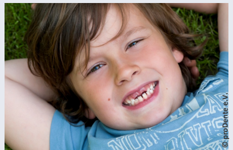
Bei der Prophylaxe lernen Ihre Kinder die richtige Zahnpflege

Es gibt also keinen Grund, warum Sie auf Prophylaxe für Ihre Kinder verzichten sollten.